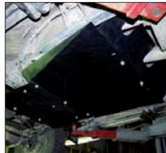
15. 0529, Patrol GR II 5trg.