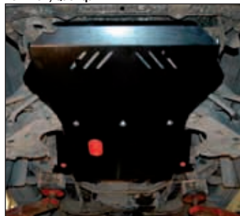
15. 0278, Terrano / Pick Up MD 21