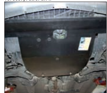
15. 0865, Primera