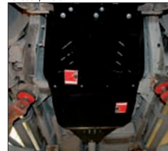
15. 0923, Navara