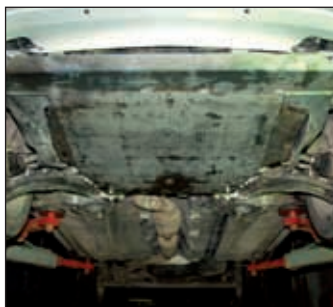
15. 0288, Almera Tino