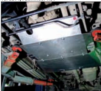
15. 0473, Patrol Y60/61