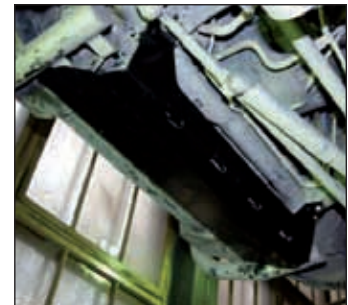
15. 0607, Patrol GR II