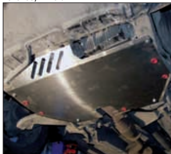
15. 0503, Murano