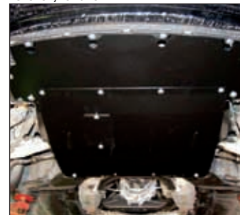
15. 0809, ZX 300 / 350Z