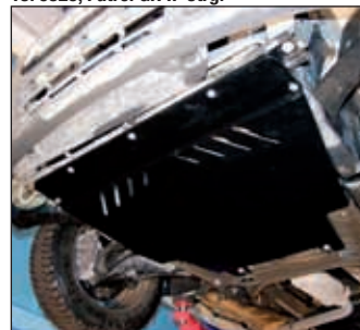
15. 0687, Primastar