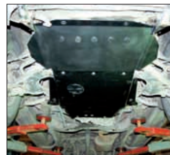
15. 0201, Terrano II