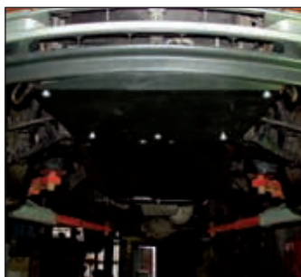
15. 0377, Serena