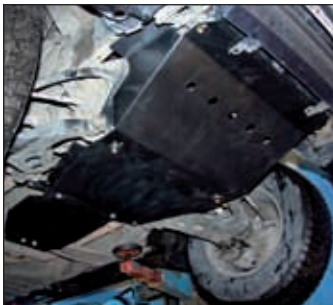
15. 0214, Pathfinder R51