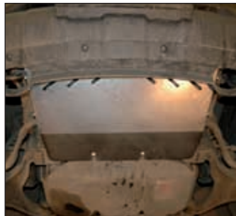
15. 1330, Pathfinder R51