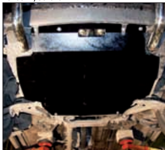
15. 0823, X-Trail T30