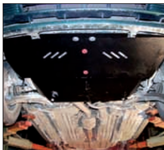
15. 0155, Almera