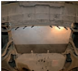
15. 1330, Navara D40