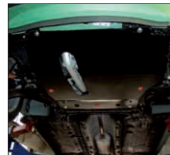
15. 0507, Micra