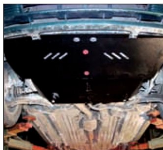
15. 0155, Sunny