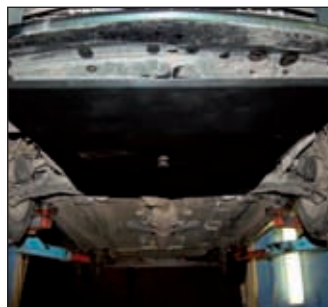
15. 0242, Maxima QX