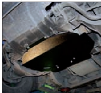
15. 0757, Navara D40, Pathfinder R51