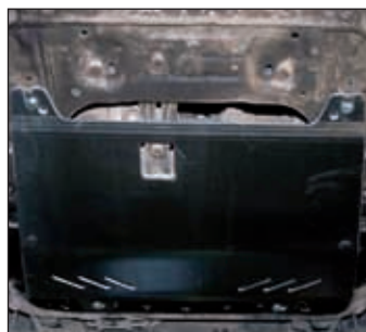
15. 1104, Qashqai