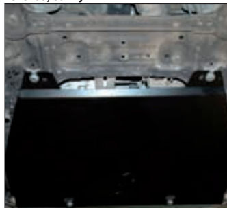
15. 1218, X-Trail T31